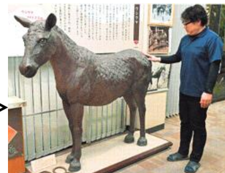
たねがしまほうげん

たねがしま 種子島には80年前まで、小さ めで、見た目が牛に似た「ウシウ マ」という馬がいたそうです。 400年あまり前、戦国武将・島 津義弘が朝鮮から連れて帰り、 西之表市安城で保護したのが始 まりだそうです。くわしくは、鉄砲 館に行ったり、南日本新聞1月5 日付の記事を読んでくださいね。