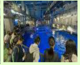
【釜蓋神社で体験】【鹿児島市水族館】